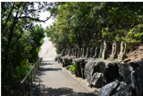
海から千里観音に至る参道