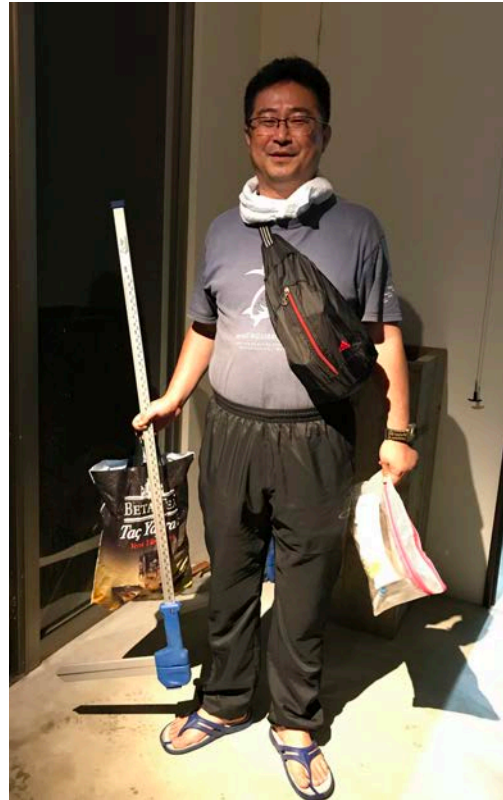
装備の一例、ビーチでは沢たびを着用