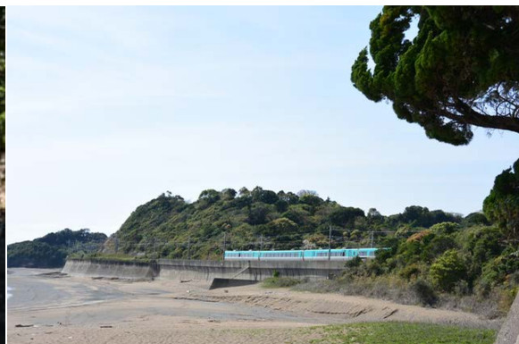
紀勢本線沿いの浜にウミガメが産卵に来る