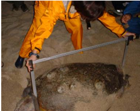
背甲の測定をしている所