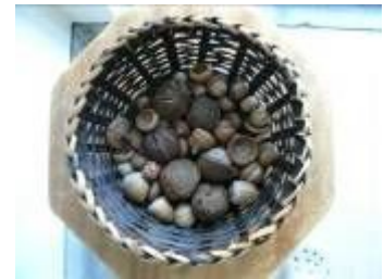
持ち帰ったドングリ

ニューヨークという大都会の中にも豊かな自然があり、環境保護を進めるための地道な調査活動をしている人たちがいること、その調査活動の方法、観察することができた動植物等をパワーポイントを見せながら、伝えた。また、持ち帰ってきたマツカサやドングリも見てもらい、日本のものとの違いを比べた。