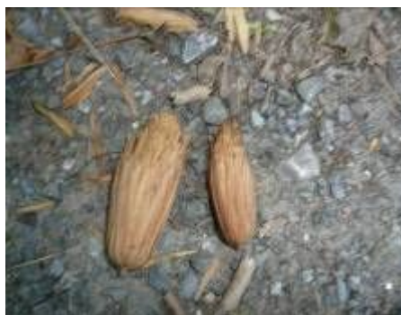
チューリップトゥリーの種子が入っているカサ