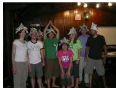
アメリカの新聞紙で折ったカブト