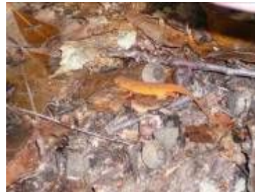
オレンジ色のトカゲ