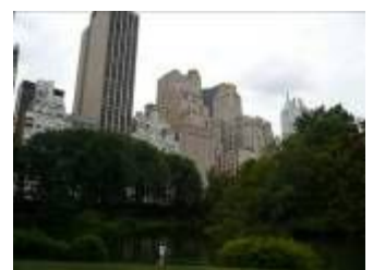
高層ビルの中のセントラルパーク