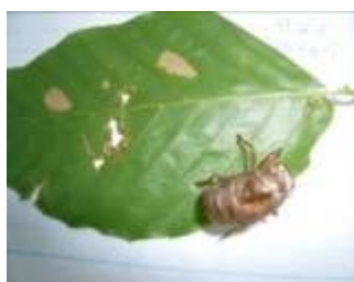
葉に付いたセミの抜け殻