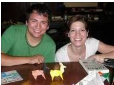
高いシカを完成させた！