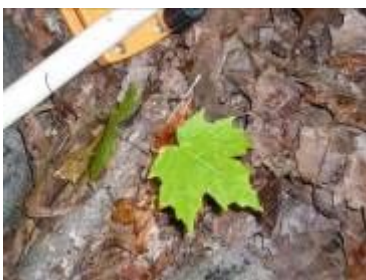
シュガーメイプル