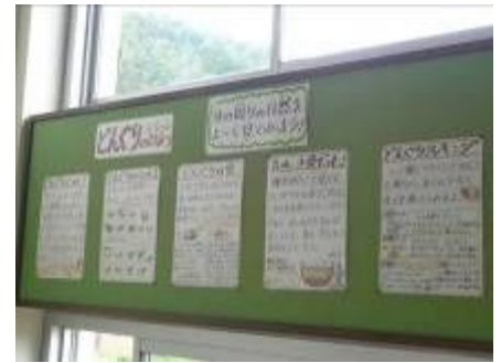
ドングリの掲示物

私が教科担任をしている中学校 1 年生から 3 年生までの生徒に、各学年の授業の中で体験報告をした。体験者が生き生きと語ることで、他の国の自然環境や環境保護の様子等について生徒はより身近に感じ、興味・関心をもつことができると考えた。報告会は、「自然環境調査」「アメリカ文化」「国際交流」の 3 つのテーマに分けて行った。また、持ち帰ってきたマツカサやドングリは校内に展示し、紹介の掲示物を作った。