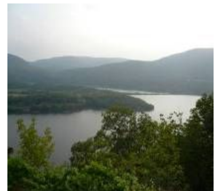
夕暮れ時のハドソン川

ニューヨーク市野生生物保護協会会長で、鳥類の専門家である彼は、マンハッタンの自然環境の推移と自然保護の必要性について分かりやすく講義をしてくれた。近年人間の活動による影響で、野生生物の生態系が著しく変化しているということ、在来種と外来種が時代で大きく移り変わっていること、これ以上地球環境が悪化しないように、対策を講じなければならないことを教えたくれた。自然と共生していくことの必要性、教育や社会にこの調査結果をどのように示していくかを考えさせられた。講義後、彼はみんなをハドソン川景観鑑賞に誘ってくれた。