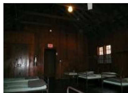
ベッドルーム(シーツ類は持参)