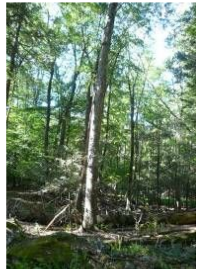
倒木から新しい木が育っている