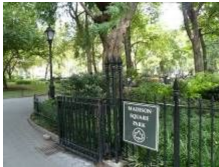
植物が多いマジソンスクエア公園