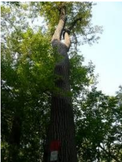
幹の形がおもしろいチューリップトゥリー

今回の参加に際して、気持ちよく送り出してくださった清見中学校職員の皆さん、多岐に渡ってご支援くださったアースウォッチ・ジャパンの関係者の方々、現地での活動でお世話になったスタッフやボランティアの方々、そして、教員フェロースhipを援助してくださった花王株式会社様に深く感謝の意を述べ、本報告を終わりにしたい。