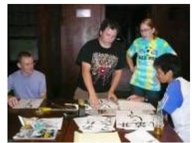
自分の名前を書く書道教室開催！