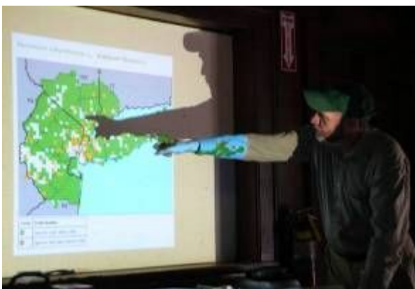
野生種ブルーベリーの分布の推移