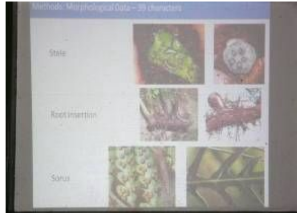
シダ植物の分類のポイント

このあたりの林で見かけるオークの種類とアッシュとヒッコリーの見分け方のポイントを教えてもらった。葉の付き方がアッシュは対称だが、ヒッコリーは非対称で、ヒッコリーの葉はカモミールのようなにおいがするそうだ。シダ類の同定は、孢子の形や孢子嚢の配列、根の付き方、茎の断面（導管、師管の配列）の様子やDNA データ等で調べるとのことだった。植物学のエキスパートである彼は、論文発表のような熱い語りで講義をし、調査現場でも熱心に植物の見分け方の指導をしてくれた。