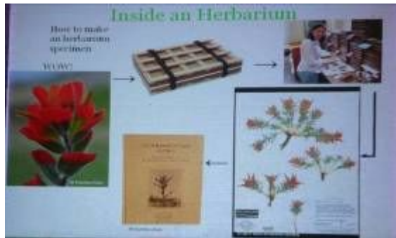
植物標本の作り方