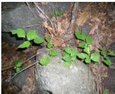
ポインソーンアイビー