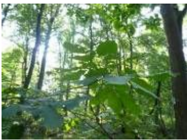
朴 の 木 々