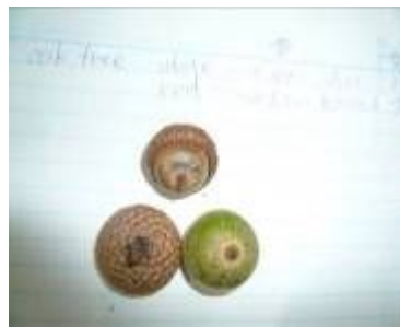
ホワイトオークとレッドオーク