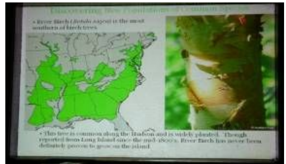
南方に分布するリバー・バーチ