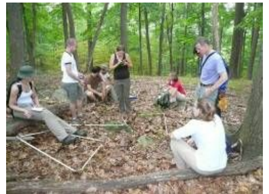
調査チームの仲間