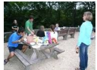
スタッフが用意したバーベキュー (ホットドッグとチョコマシュマロサンド)