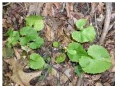
ガーリックマスタード