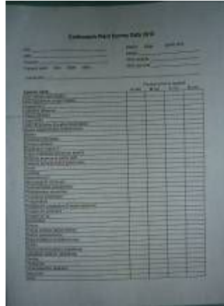
Plant Survey Data 用紙