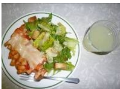
パスタ、サラダ、レモネード