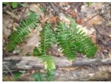
ニューヨークフラン