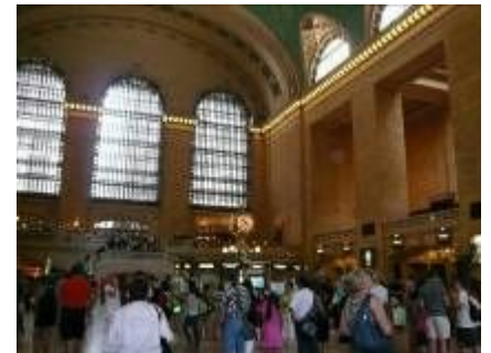
グランドセントラル駅

13:00 NY グランドセントラル駅集合。アースウォッチのTシャツを着たスタッフが4人迎えに来てくれた。後の2人のスタッフは現地の駅で待っていてくれた。電車で1時間余りでピークスキル駅に着いた。スタッフの車で10分程でブルーマウンテン国立公園内のロッジへ。部屋に荷物を置き、外のテラスに出て自己紹介をし、活動のオリエンテーションがあった。