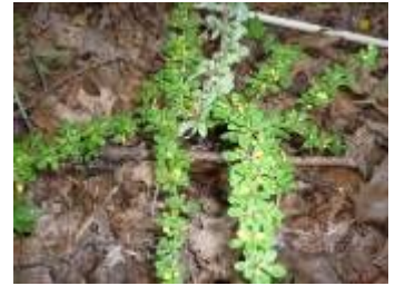
ジャパーニーズバーバリス