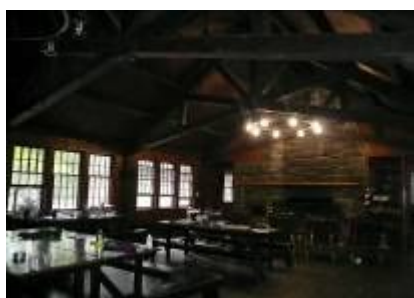
食事や団樂のリビングルーム