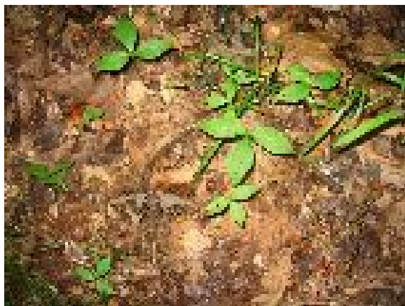
シヤカシの芽ばえ

の段階ではそれほど日光を必要としないので。)か、陰樹(光に対する要求性が比較的少ない種)ぐらいしか確認できなかった。日本ではこのような調査では対象物を宝石のごとく大切に扱うかと思うが、アメリカでは芽生えをすぐに抜いて調べるなど少し乱暴な調査活動だなと思うこともあった。