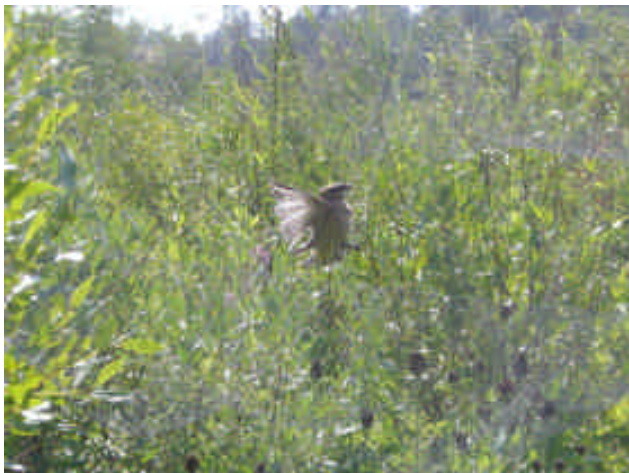
かすみ網にかかった野鳥

バスに乗って野外調査地へ向かいました。途中で、TSSのジャクソンキャンパス近くを通りました。それぞれのグループごとに調査地をわけ、昨日練習した調査を行いました。黒田先生とともに調査を行ったのですが、なかなか足輪まで見ることが出来ませんでした。右足に銀の足輪をしているアメリカン・ロビン1匹だけを見つけることが出来ました。しかし、色のついた足輪をしている野鳥が調査対象だったので、このデータは結局無効となりました。