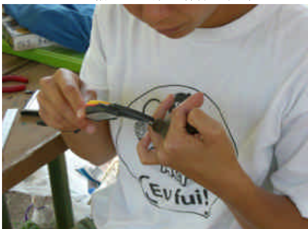
捕獲した野鳥の測定

野外調査地から Kelly キャンパスへ戻り，鳥の足輪を着ける作業の説明と，見学をしました。かすみ網にかかっている鳥を回収し，種別，性別，くちばしの長さなどを細かく測定したのに地に銀色の足輪をつけ放つ作業を見学しました。放つ作業は実際に私たちにもやらせてくれました。