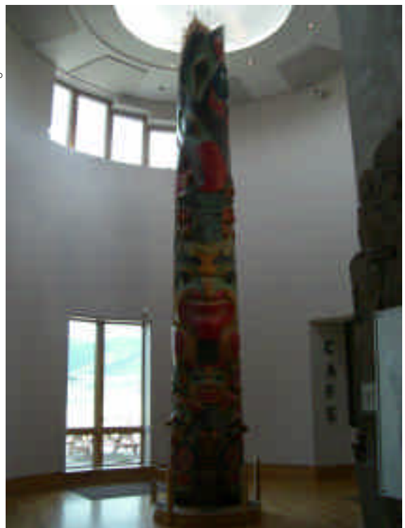
国立自然美術館にあったモニュメント