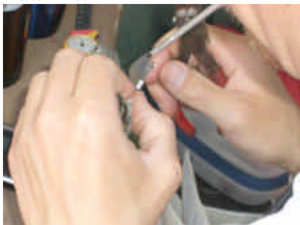
捕獲した野鳥の足輪付け