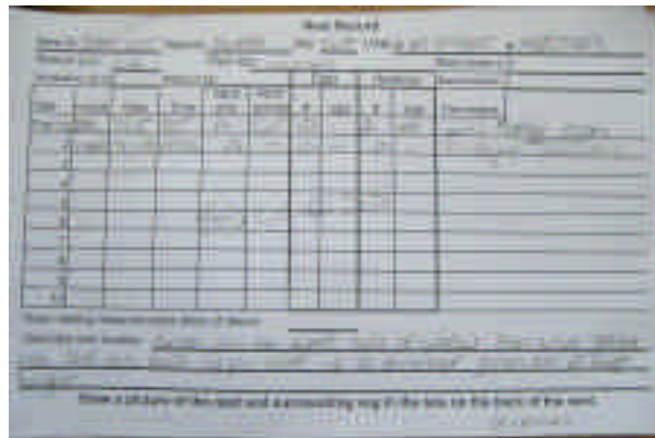
使用した巣のデータカード