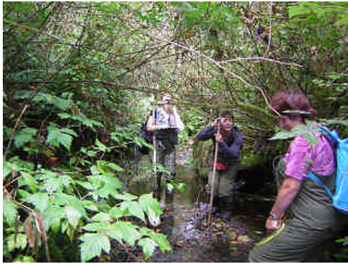
Klahoya creek(下流)での河川構造調査

今日は、スカジット川最上流部での調査である。場所は、Marblement を南に入った