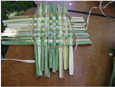
ガマの茎を使った敷物 (Cattal Mats)

についてのオリエンテーションが始まる。胸まである長ズボン型の靴を履き、その上に更