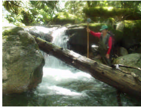
Jordan Creek(上流)＜滝の高さも計測＞

Jordan Creek (図2) である。調査項目は、昨日と同じである。車止めから北東に川への道を下っていく。川で出ると、そこから、さらに下流に進む。私が調査で通っている奈良県奥吉野の溪流部の景観と変わらない。心躍る。私は、主に水深を測定する。滝の高さも入れていく。最も深い場所で、1.5m を少し越える程度。フェルトの靴底がいかにも有難く思う。気軽に岩場を歩ける。