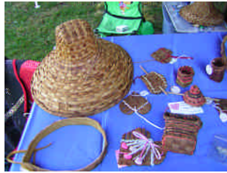
ヒノキの樹皮で使った帽子

にフェルト地の靴を履く。近くの山と川に出かけて、さっそく事前の実習を行う。サルオガセがびっしり生えた森林への一步を踏み込んだ。①樹高を調べる。②樹木の間の距離を測る。③レベル測量を行う。④樹齢を調べる。⑤胸高直径を測定する(くぎを打って測定：標識つける)。シルトが混じった白い川を横切る。このシルトは、工事や伐採によるものではなく、氷河によるものであると、ラルフは説明する。私は、川の石をめぐって、ヒラタカゲロウ、ツツトビケラを観察する。夕食を外で食べる。私はお菓子作りを行う。夕食の前に、芝生の上でゲームを楽しむ。仕事と遊びのバランス感覚がよいと感じた。これが、国際交流の場ともなる。アブ Yellow Jacket は、夕食を食べているとよくやってくる。この時期に出てくるのは日本と同じだ。夜が深まると、星が見事に見える。北斗七星は、Big dipper (柄杓) と言う。あとで、dipper は、カワガラスのこと(もぐって虫をとる水鳥)をさすことも分かる。なるほど、カワガラスは柄杓と同じ動きである。このように、自然に関する言葉の語源を調べる楽しさを感じることができた。