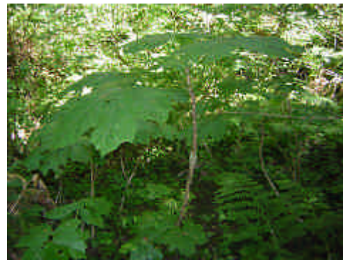
ハリギリの1種 (Devils club)