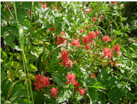
Indian paintbrush( Castilleja miniata )

ゴ Thimberry( Rubus parviflorus )によくでくわすので、食べながら歩く。Indian paintbrush ( Castilleja miniata ) の朱色の花はいかにも鮮やかに群生しており、よく出会う。中腹あたりから、北西にベーカー山 (Mt. Baker : 3286m) が突如として雲の上に見え出す。山頂を覆った真っ白な氷河が見事に見える。南東を見ると、氷河を抱く White chuk、White horse の峰などがよく見える。眼下には、曲がりくねったスカジット川の流域が見事に見える。山頂付近は、岩場が多くなり、山頂の東からは眼下に、氷河が削った後にできたきれいな湖 (Sauk Lake) が見える。