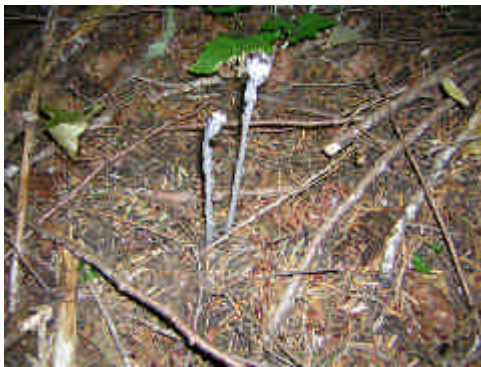
ギンリョウソウの1種 (Indian pipe)