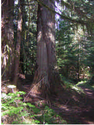
ヒノキの1種 Red cedar (樹皮が削られている)