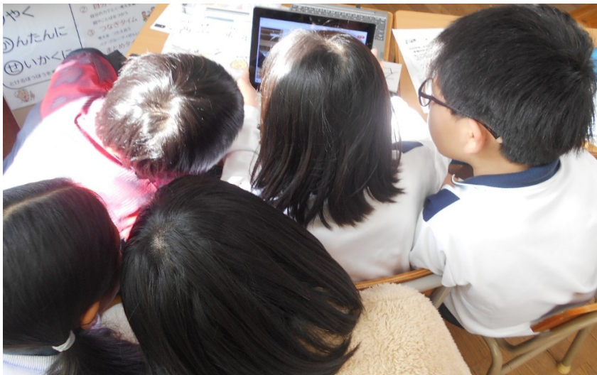
〔↑ 画面越しに繋がる子供達〕