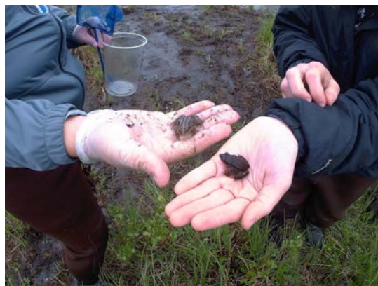
図12 カエルの生態調査

写真は沼で採取したカエルである。訪問した8月の調査地の気候はとても快適だった。しかし、数ヶ月後には雪が降り沼は凍ってしまうことになる。どのようにしてカエルが極寒の時期を乗り越え、種を残していくのか興味を持った。研究者からは成体は体を凍らせて冬眠状態にして過ごすが、一方で全てが解明されていないと教えていただいた。授業でもこのトピックを取り上げ身近な小動物の不思議を考えてみたい。