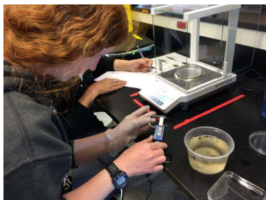
図3 研究室での作業の様子