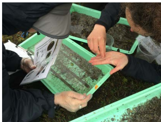
図13 水生生物の観察と分類

写真は網で捕らえた水生生物をパットに入れて確認している様子である。目をこらして見ると小さい生物がいることがわかる。これらを更に観察すると体のつくりや動きがわかる。これらの特徴によって水生生物を分類し個体数を数えていった。これらの作業を通して感じたことがある。普段見逃していることに目を向けることで発見があることである。視野を広げ、多面的に見ていくことは大切である。この視点も今後の授業づくりに活かしていきたい。