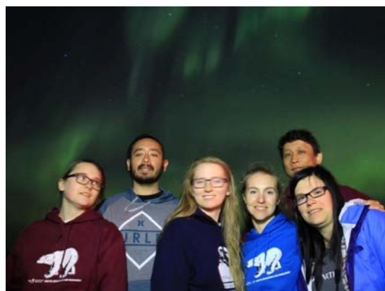
図14 オーロラとメンバー

研修に参加したメンバーは国籍，年齢，職業が異なっていた。このメンバーと，研修中はもちろん，夕食後の自由時間や休日にもいろいろな話げできた。「研修」という目的では集まったメンバーだが，約2週間を一緒に過ごすことで，メンバーの生き方，思いや考えなど新し発見にも触れることができ，つながりを深めることができた。今回の出会いをきっかけに，このつながりを大切にしたい。