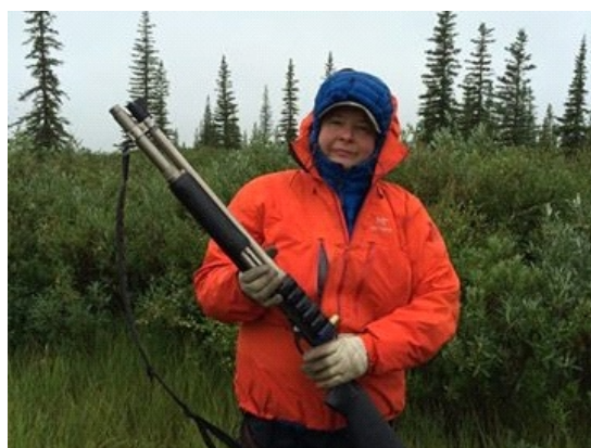
図 7 調査中は銃持参で安全配慮

初日のオリエンテーションで調査の危険性について説明があった。調査地では野生動物が生息しているため，危険が伴うので注意せよとのことだった。その後，フィールドワークでは，銃を持ったスタッフにはさまれ，調査地に向かった。そもそも銃を間近で見たことのない私には，この風景を見て調査地のリアルな自然を実感することになった。