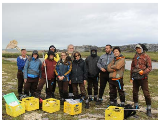
感謝 プロジェクトチーム

最後に、本プロジェクトに参加したメンバー、研究所でお世話になった先生方、研究所のスタッフの皆様、そして、本プロジェクトの機会を与えていただいたアースウォッチ・ジャパン様、花王株式会社様に心より感謝申し上げます。