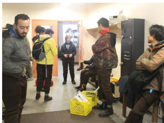
図9 フィールドワーク前の様子

写真はフィールドワークに出かける前の様子である。ここで中央のスタッフから「ダブルチェック」の声がかかる。黄色のコンテナには、調査で使用する器具や準備物が入っている。何か一つでも足りなければ調査はできない。この言葉は研修中いろいろな場所で聞かれた。たった一言であるが、調査を行う上では基本となる。学校戻ってから、この言葉は理科の授業でも活用し、実験、観察時の合い言葉となっている。