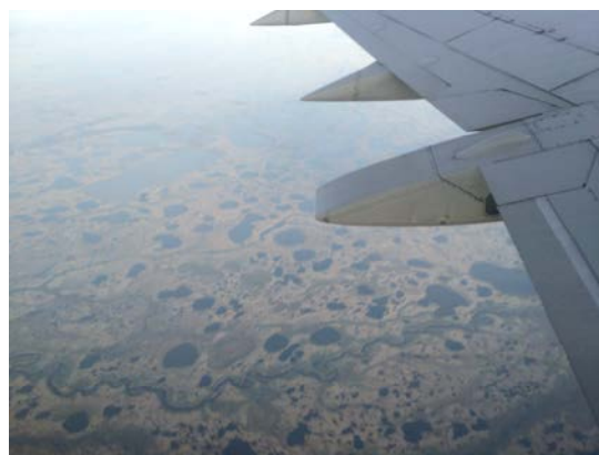
図1 飛行機から見た調査地付近の様子

調査地のチャーチルはハドソン湾の海岸沿いにあり、北米最大の湿地帯の町である（図1）。夏季は雪が解け、湿地帯になり、数多くの沼が点在し、様々な生き物が生息している。また、約 57000 頭のペルーガと約 1000 頭のシロクマが生息し、世界のバードウォッチングスポットのベスト 10 にランクされているなど、自然動物豊かな町でもある。