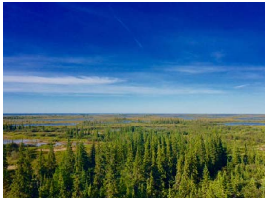
図 5 夏の北極圏の様子

北極圏という一面の氷の極寒地をイメージしていた。しかし，調査地は冬季こそマイナス 20 度になるが，夏季は過ごしやすい気候であった。写真は研究所から見た風景である。見渡す限り，空の青と樹木の緑が広がる世界だ。空を見ると太陽や雲を周りの建物に遮られることなく観測できた。夜はオーロラも観測することができた。体全体で地球の大きさと自然を体感した。