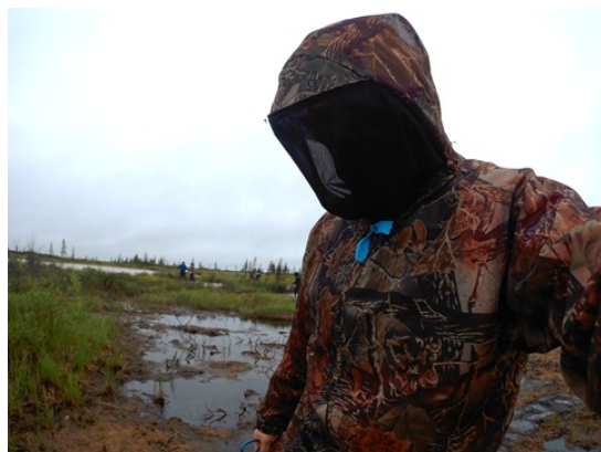
図 6 フル装備でフィールドワーク

写真は調査の一コマである。頭からフルフェイスの虫除けネットをかぶっている。この時期は場所にもよるが，湿地帯ゆえ蚊が多い。呼気に誘われ相当数の蚊が集まってくる。フィールドワークに出かける前の着替えでは必ず首，足首，手首なども入念に装備して蚊の侵入を防いだ。これほどまで蚊に対して装備したことはない。蚊に囲まれての作業も初めての体験となった。