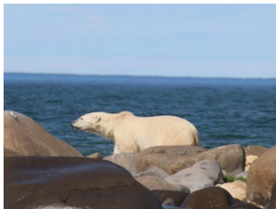
図11 海岸線を闊歩するシロクマ

写真は調査地で見かけたシロクマである。これまで野生動物は、保護する視点で考えていたが、スタッフから、「動物の生態を考えると環境保全をする、共存する、関心を持つ視点を大切にしている」と聞いた。今回の研修ではカエルや魚の生態調査を行った。この言葉を聞くまで、カエルや魚を調査のための小動物として見ていた。しかし、環境保全、共存、関心の視点で動物を見ることで、調査を俯瞰的に見ることができ、思考を広げることができた。