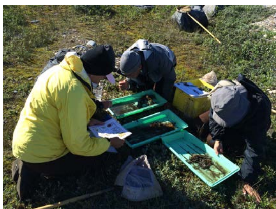
図2 フィールドワークの様子