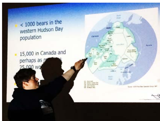
図4 レクチャーの様子