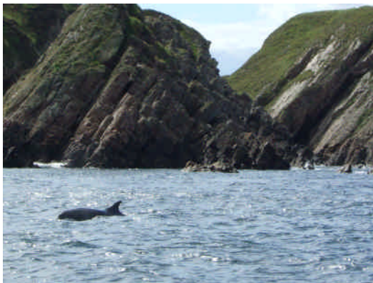
大自然の中で見た、イルカ。

どこまでも続くスコットランドの海原でたくさんのイルカにあったときのこの感動、言葉では言い尽くせない。自分が自然の一部であることを心で感じる事ができた。