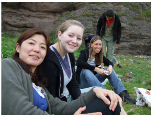
ビーチヘピクニックに行った日。

お互いの文化を尊重しながら、生活レベルでそれぞれの国の人間が自分の国の現状を話す。そして、いろいろな違った視点からアイディアを出し合う。「そういう考えもあるのね。」「それ面白いね。」と自分の視野を広げる事ができることほど、話をしていて面白い事はない。今、私が英語を教えている生徒達すべてが将来このような経験ができるように、と思いつながり毎日授業をしている。