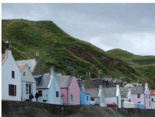
CRRU の本部がある通り。

実際、このプロジェクトに参加させていただき、多くの事を学ぶことができた。本当に感謝している。日頃休みがとれないので、日程的にはもちろんであるが、気持ちできにも余裕のある夏休みにこのような経験をさせていただき、私自身「この経験をもとに2学期も頑張ろう」という前向きな気持ちを持てたことが、本当にうれしかった。