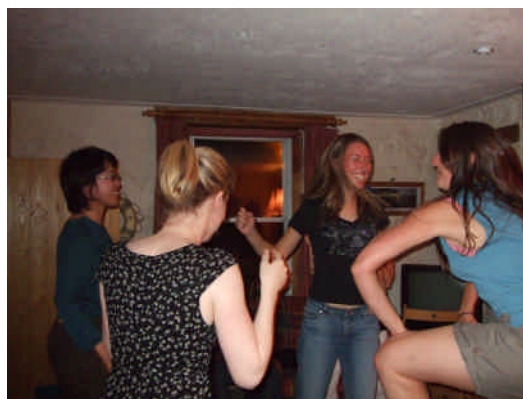
夜に行った、ダンスパーティ。