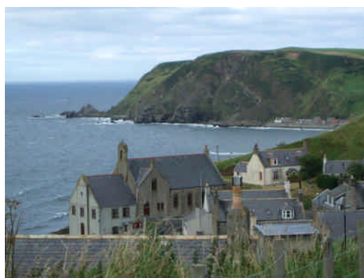
滞在した場所の高台より。いつまで眺めても