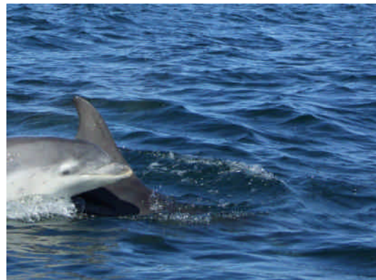
お母さんと子供のイルカ。何十枚と撮った写真の、私のベストショット。