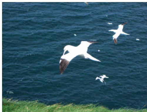
「ガーネット」と呼ばれる鳥。何千羽もいた。1匹1匹表情が違っていて観察するのが楽しかった。