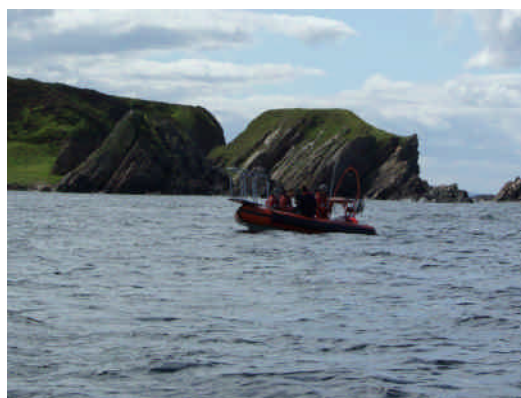
ボートは、キートスとオーカIIがあり、2つのチームにわかれ、乗り込んだ。