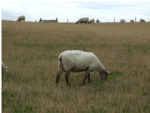
草を食べ続ける羊。大草原の中で、のびのびと生活していた。

自然環境は大切だ、環境教育は大事だ、頭ではわかっているでもその人自身が実際に自然にふれあい、自然を愛する気持ちが滞かなければなかなか難しい問題ではないか、と思う。そういう意味で子供たちがもっともっと自然と触れ合う機会をもてるようにするのも大人の責任ではないか。教師として、子供達と自然をもっと近づけるために、私自身も具体的には、咲いている植物の話とか、気候の話など、教室の中に自然の話題をこれまで以上に入れていきたいと思う。